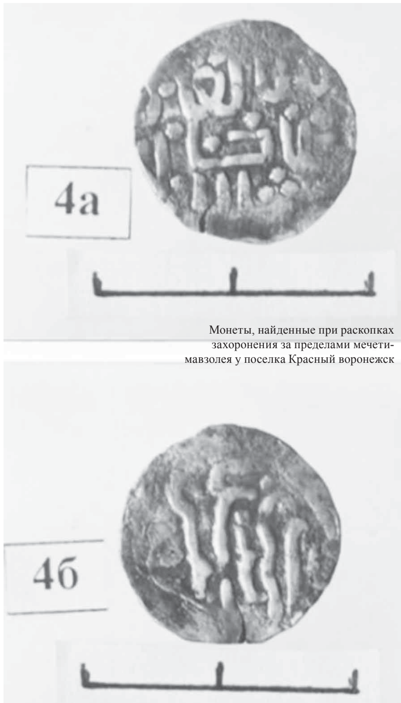
Монеты, найденные при раскопках захоронения за пределами мечетимавзолея у поселка Красный воронежск

Публикацию подготовил Дамир ХАЙРЕТДИНОВ , кандидат исторических наук, этнолог