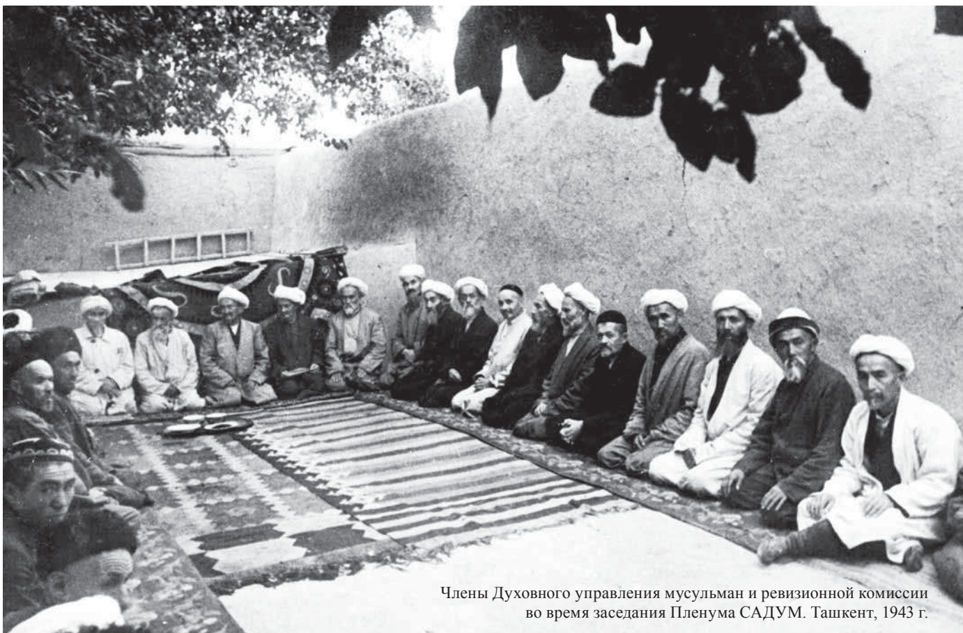
Члены Духовного управления мусульман и ревизионной комиссии во время заседания Пленума САДУМ. Ташкент, 1943 г.

III Всероссийский съезд мусульманского духовенства состоялся в октябре 1926 г. На нем присутствовали делегаты и гости из Узбекистана и Крыма. Муфтием и председа-