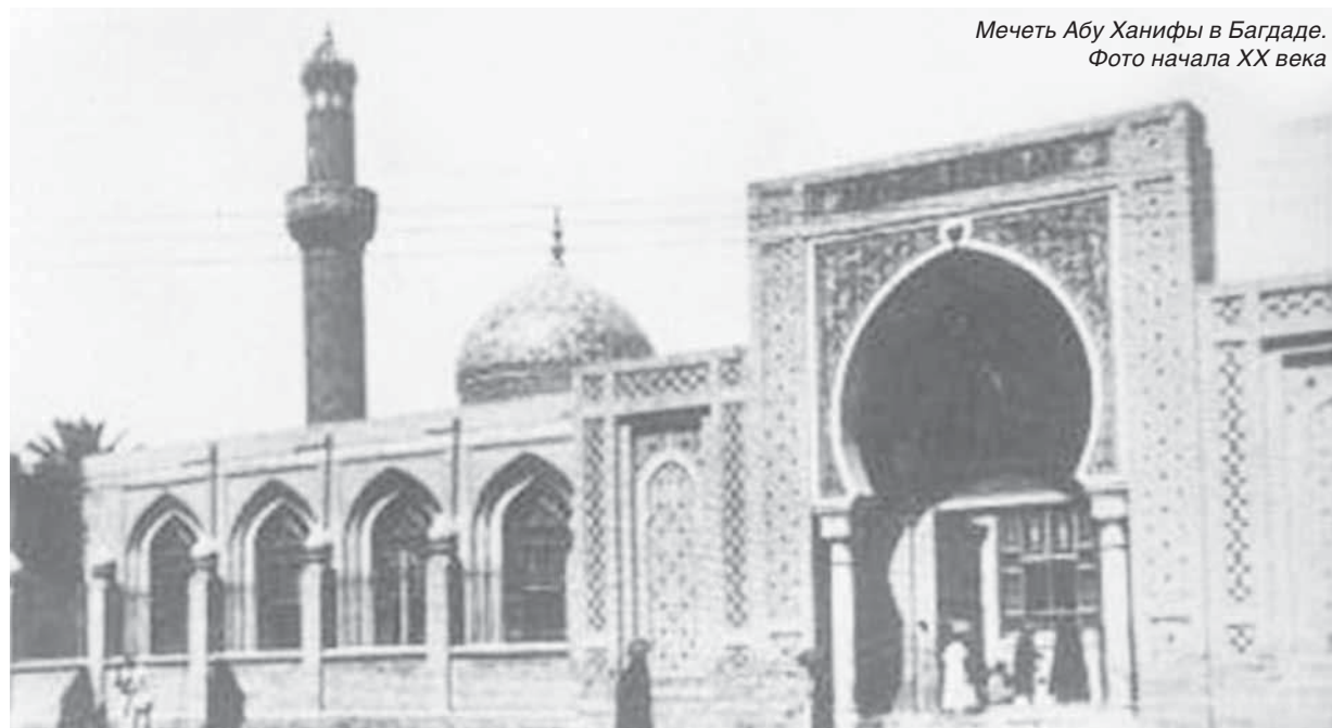
Мечеть Абу Ханифы в Багдаде. Фото начала XX века