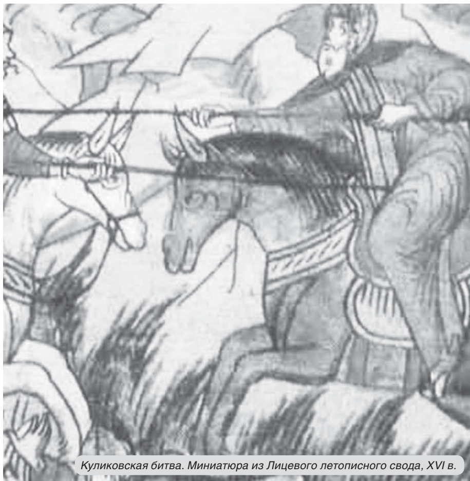
Куликовская битва. Миниатюра из Лицевого летописного свода, XVI в.

Однако подобные приобретения, добытые незаконно, не всегда признавались другими странами. Международное право существовало и в XIV–XV веках, как это ни покажется нам странным. Вот что сказано по этому поводу в статье И. Г. Бурцева: «После захвата Татарских мест Москвой и Рязанью сложилась весьма непростая ситуация. С одной стороны, захваченные территории фактически принадлежали Москве и Рязани (с присоединением Рязани Москва «подобрала» к себе и рязанские Татарские места), с другой — они не имели юридических прав на эти земли, поскольку это ордынские территории и ярлык на них князь получить не мог. По мнению В. Егорова, Тула была личным владением царицы Тайдулы; это дает основание предположить, что после ее смерти тульские земли остались в ханском домене. Эта двойственность, связанная с фактическим