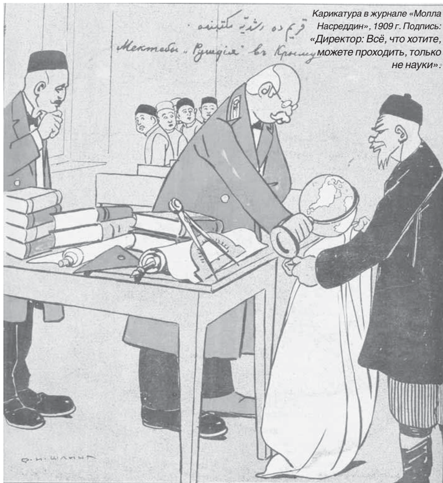
Карикатура в журнале «Молла Насреддин», 1909 г. Подпись: «Директор: Всё, что хотите, можете проходить, только не науки».